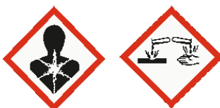
Danger pour la santé