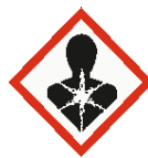
Danger pour la santé